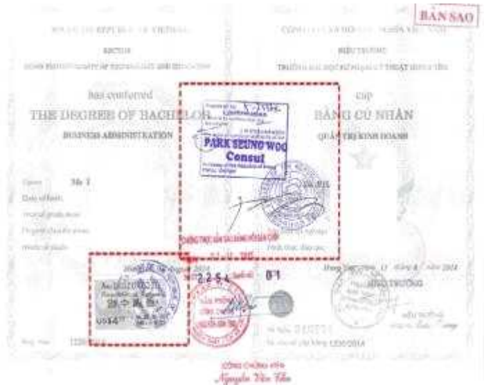
<越南学位证书大使馆认证>