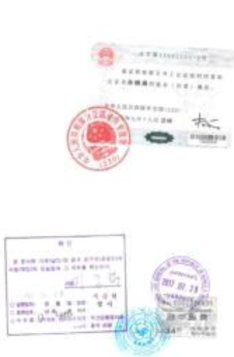
<中国学位证公证件大使馆认证>

大使馆学位证明认证书 Verification of diploma from Korean Embaasy