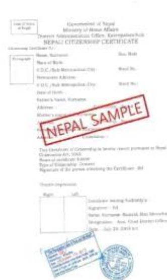
<尼泊尔家族关系证明书公证件>

大使馆学位证明认证书 Verification of diploma from Korean Embaasy