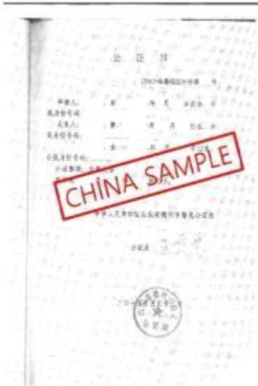
<中国亲属关系证明公证书>

出生证明和家族关系证明 (如果原件不是英文则需要附加翻译件) Birth certificate