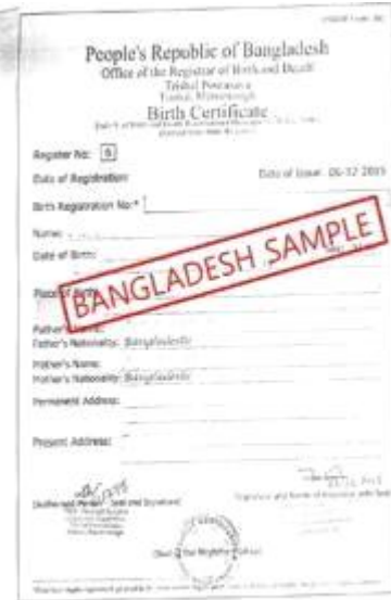
<孟加拉国出生证明书>