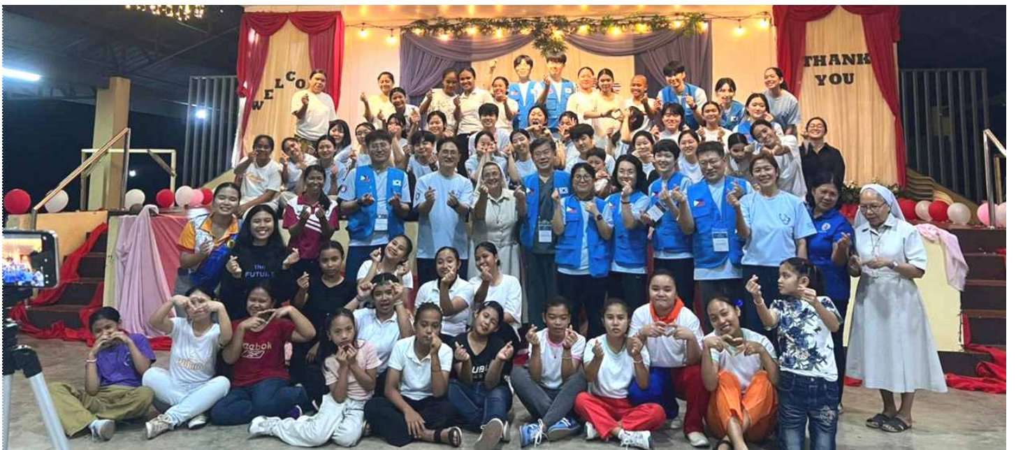
<Cabug의 Capuchin 수녀원에서 수녀님들과 원생과 함께.>

한편으로는 필리핀의 구강건강 현실을 보며 깊은 안타까움도 느꼈습니다. 한국이었다면 충분히 보존 치료를 통해 살릴 수 있었을 치아를 여러 현실적 제약으로 인해 발치할 수밖에 없는 상황이 반복되었습니다. 특히 소아와 청소년의 대구치를 발치해야 할 때는 마음이 무거웠습니다. 성장기 아이들에게 중요한 치아를 잃게