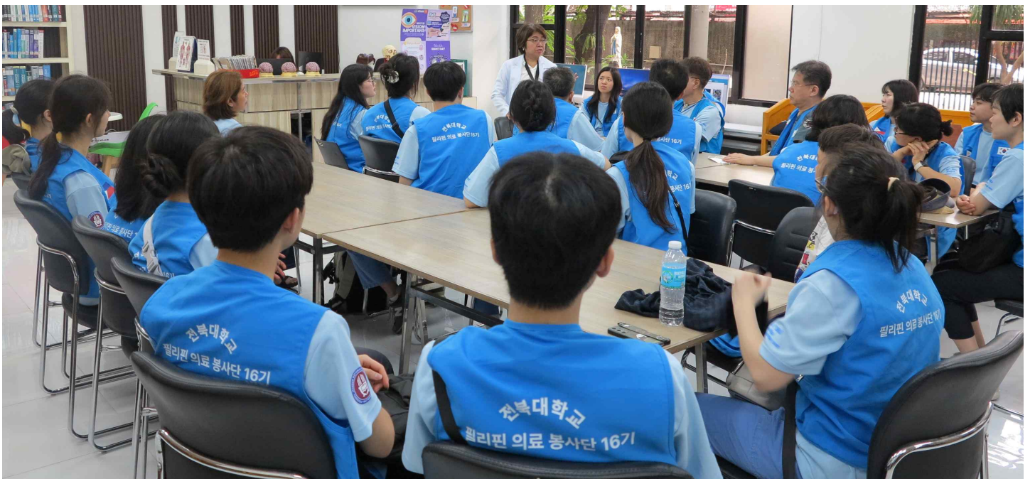
<라살의과대학 학장님과 면담.>

부끄럽지만 지금까지 저는 제 인생과 제 미래에 대해 방관자 같은 태도를 가져왔습니다. 시간이 지나고 학년이 올라가면 변하겠지라는 막연한