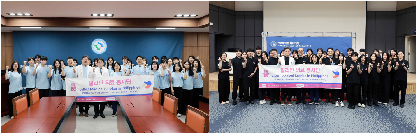
<전북대학교병원과 의과대학 발대식. 사진제공: 병원홍보실, 필봉16기>