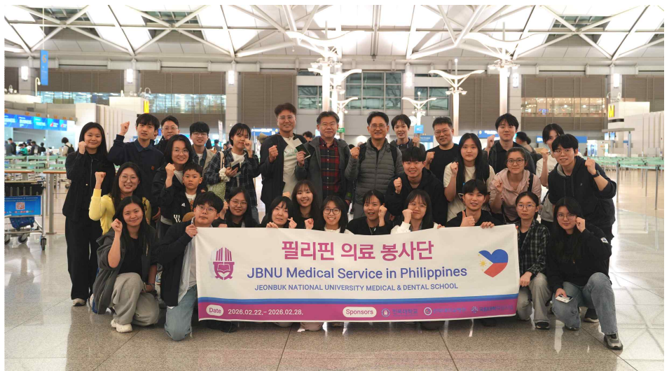
<인천공항에서 출정식. >