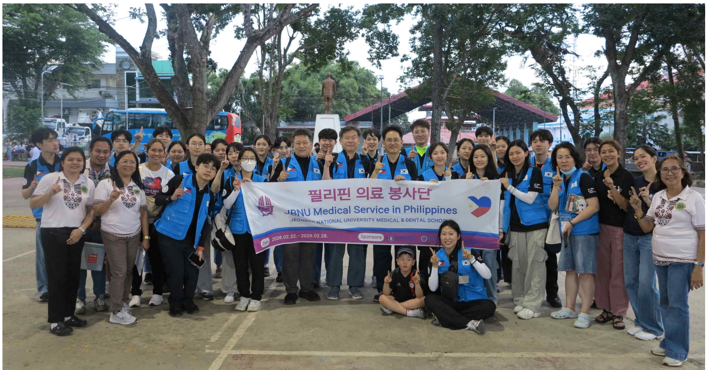
<Murcia봉사후 자원봉사들과 함께.>

이번 봉사가 하나의 활동으로 끝나는 것이 아니라, 사람과 사람을 이어주는 따뜻한 인연으로 계속 이어지기를 바랍니다. 우리가 함께 나누었던 작은 헌신과 마음들이 모여 앞으로도 필리핀 의료봉사의 길을 밝히는 등불