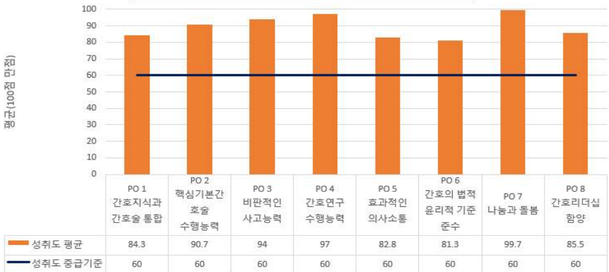
Phase II 프로그램 학습성과 성취도 평가 결과(n=99)

** 2020년 PO 4 평가는 코로나19로 문헌보고서 80%, 자가평가 20%로 시행